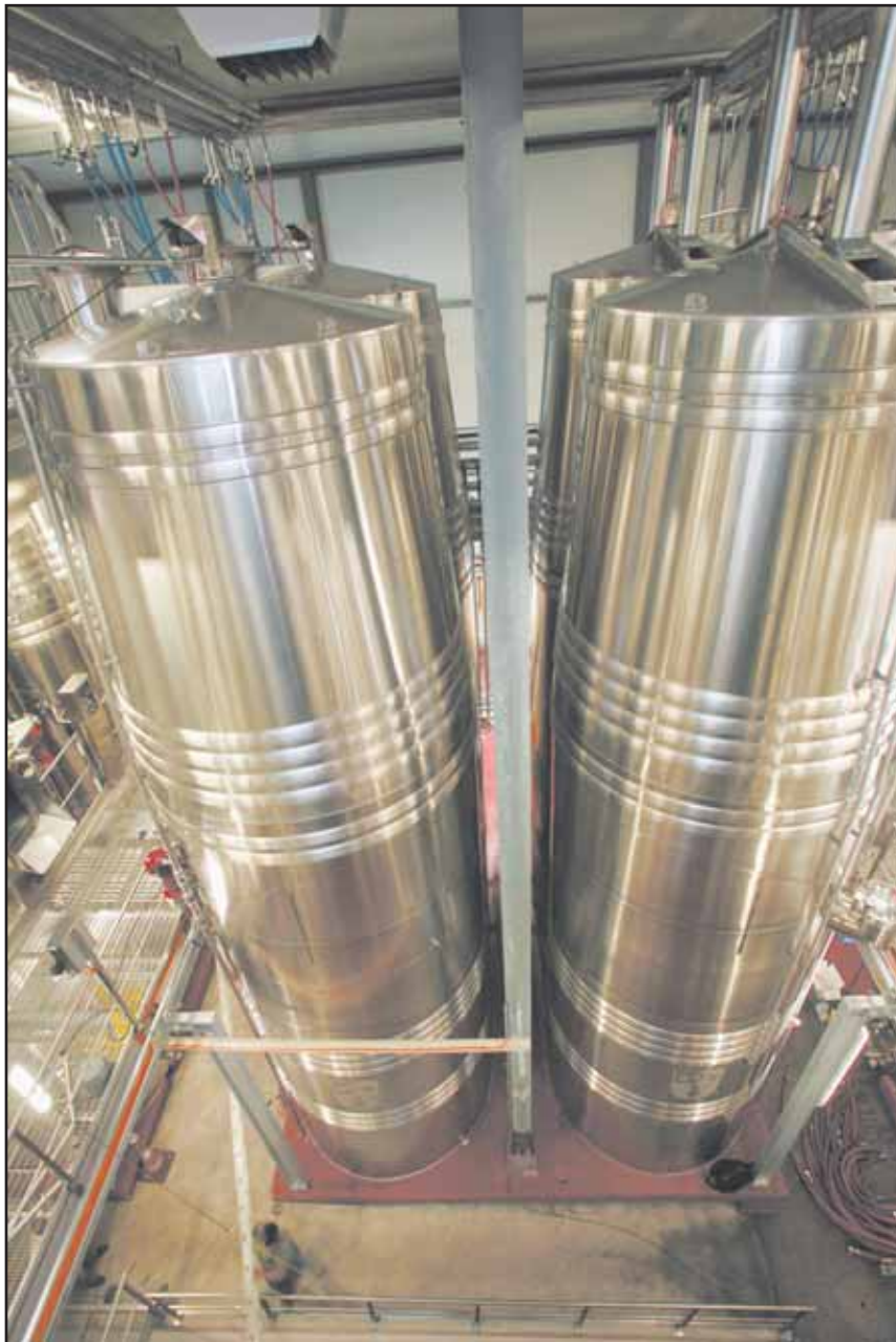
Pour assurer son avenir, Provins n'a pas craint d'entrer dans un monde futuriste qui pointe ses cuves à 14 mètres du sol. MAMIN