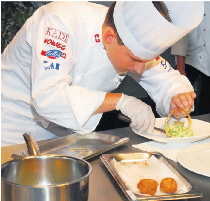
An der ZAGG messen sich internationale Spitzenteams.

Vom 12. bis 16. September 2010 findet die ZAGG Luzern statt. Sowohl Fachleute aus der Hotellerie und dem Gastgewerbe als auch Profis aus der Gemeinschaftsgastronomie kommen an der ZAGG auf ihre Kosten. Die bewährte Begegnungsplattform für Aussteller und Besucher gibt einen Überblick über die aktuellen Trends und Neuheiten aus der Welt der Gourmands. Die European Culinary Challenge verspricht auch 2010 ein Höhepunkt zu werden, wenn sich internationale Spitzenteams vor Publikum messen.